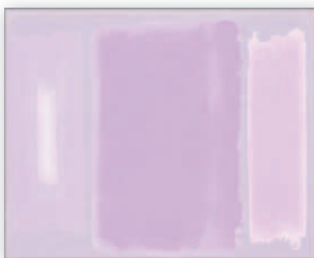
Geplantes Fenster im Foyer

Der Umbau der Friedhofskapelle hat leider viel länger gedauert als ursprünglich geplant. Dafür bitten wir vielmals um Entschuldigung und Verständnis. Wer baut, weiß nie, was ihn erwartet. Unvorhergesehenes kann die Zeitpläne verzerren und die finanzielle Planung übertreffen. Wir haben beides erlebt. Die Arbeiten werden aber nun im Januar endgültig abgeschlossen, so dass ab Montag, dem 6. Februar, direkt auf dem Friedhof am Egenbüttelweg auch die entsprechenden Trauerfeiern wieder in der Kapelle stattfinden können.