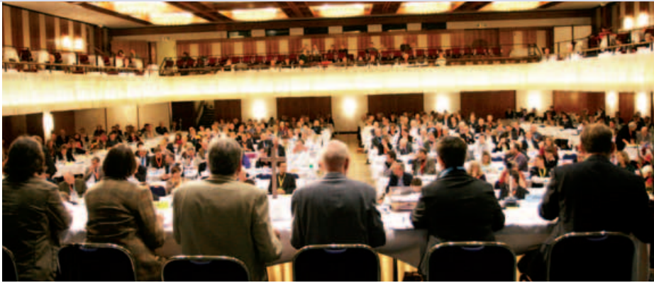
Blick ins Plenum, Fotos: Rainer Neumann www.kirche-im-norden.de