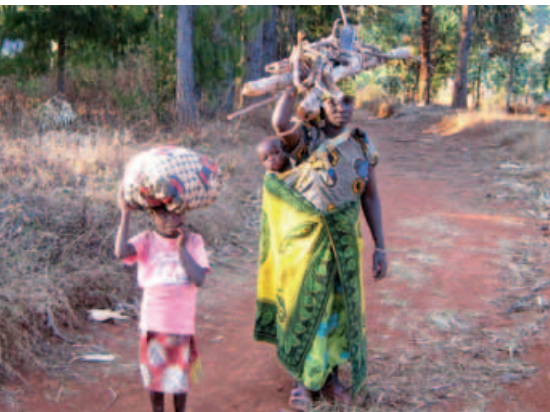
Igumbilo